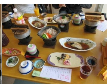
会席料理と飲み放題で、 ゆ〜っくりといただきました.....