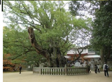
樹齢2600年!のご神木です