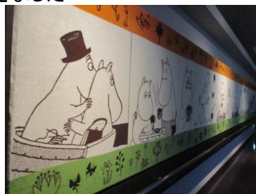
長さ40mのタオル、技術に感心!

今治は造船だけでなく 繊維工業も歴史永く 特にタオルは吸水性の高さで 定評あり 国内シェアNo.1! 美術館と工場見学ができました